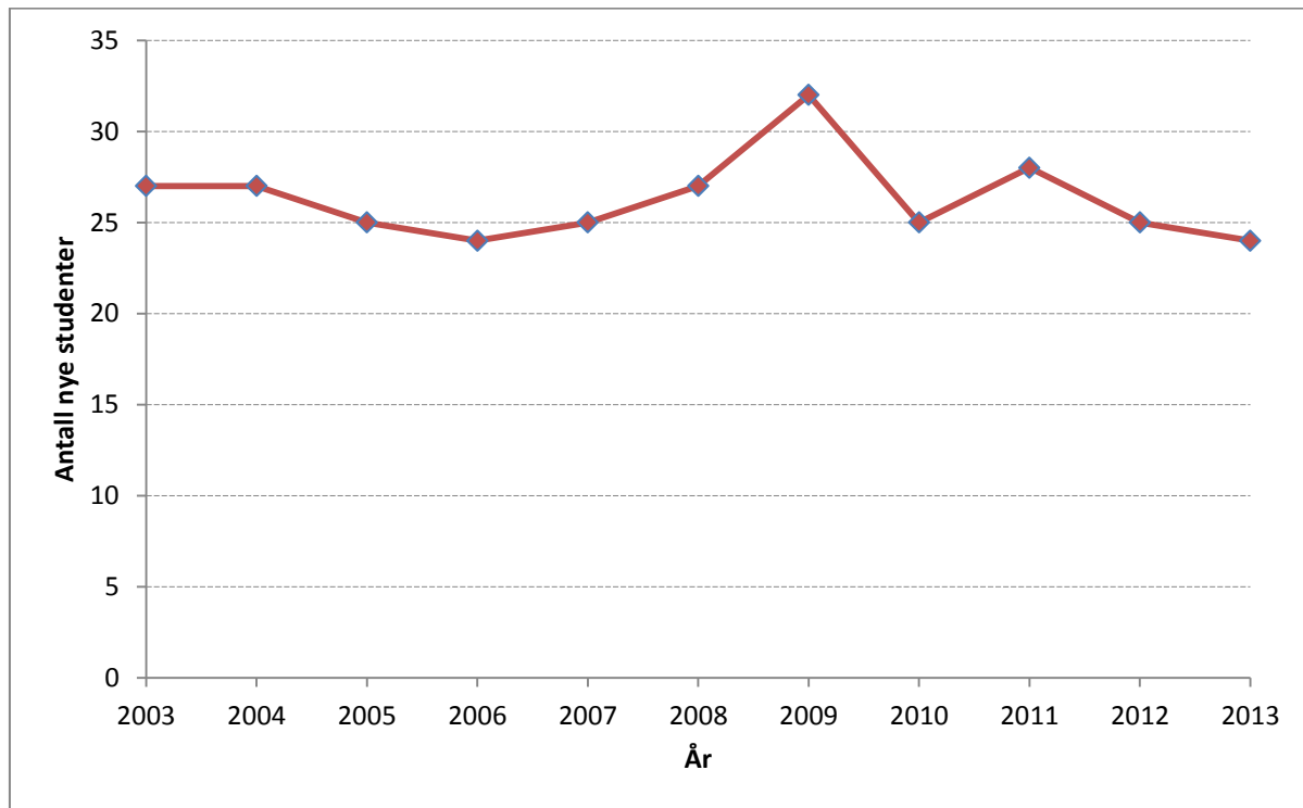
Figur 1: Nye studenter på programmet

Dessverre er det langt færre som går ut med bachelorgrad i politisk økonomi. Figur 2 viser hvor studentene som ble tatt opp hvert år ble av. Videre viser Figur 3 andelen av studentene som er på programmet som enten slutter eller blir overført til andre programmer. Mer at tallene for de siste tre årene må tolkes med varsomhet siden disse stort sett ikke er normert til å være ferdige ennå. Selv om det kan være en ørliten tendens til nedgang har frafallet ligget jevnt rundt 80 prosent som er høyt.